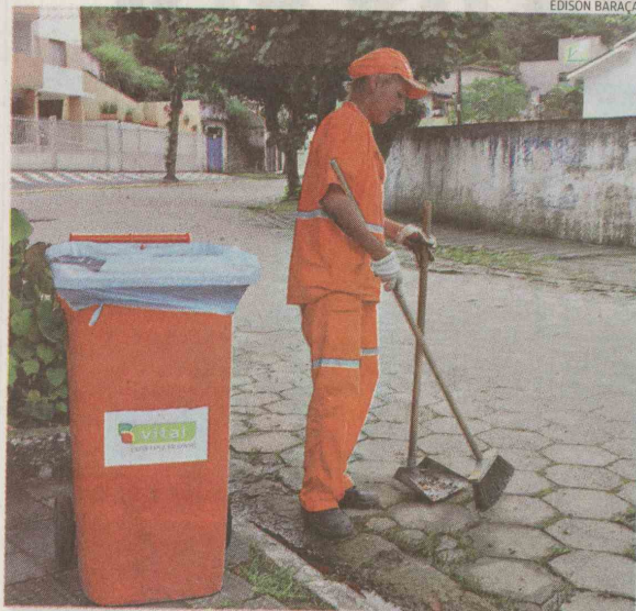
O serviço de limpeza prestado pela Vital termina na quinta-feira

"Nós notificamos a Vital de que estávamos interessados em estender o contrato, só que com a condição de que deveria haver um redutor de 20% (do preço cobrado), tendo em vista