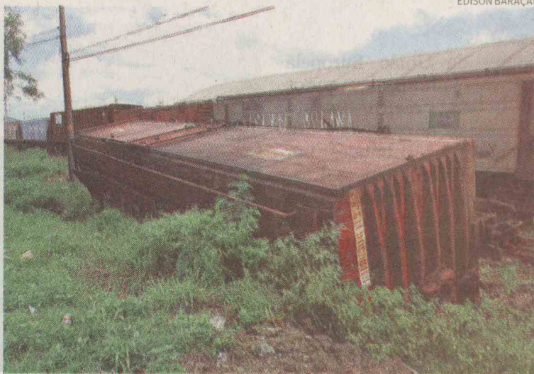
Caminhão colidiu com vagões ferroviários nas proximidades do Tecon

Em nota, a Portofer, empresa controlada pela concessionária