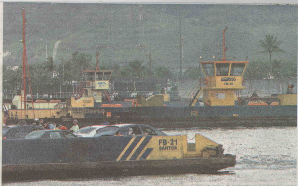
Atracadouros em reforma continuam prejudicando a travessia de balsas entre Santos e Guarujá, aumentando o tempo de espera nos dois lados

maior lentidão ocorreu por volta das 20 horas. O tráfego esteve lento na Imigrantes, sentido Capital, entre os Km 57 e 54, devido ao excesso de veículos.